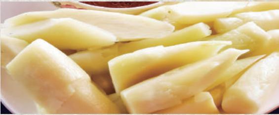
찌아오바이 무침 (줄무침)